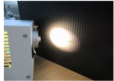
目盛 : 5